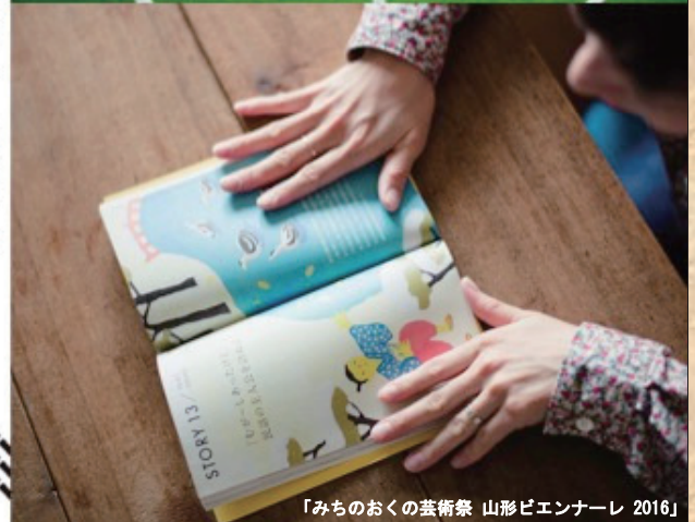
「みちのおくの芸術祭 山形ビエンナーレ 2016」